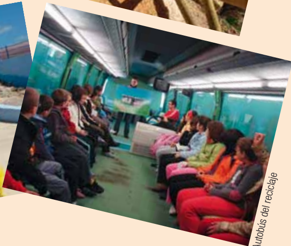
Autobús del reciclaje