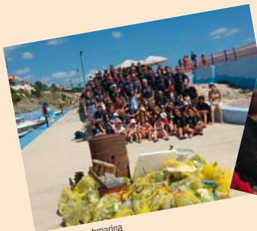
VIII limpieza submarina